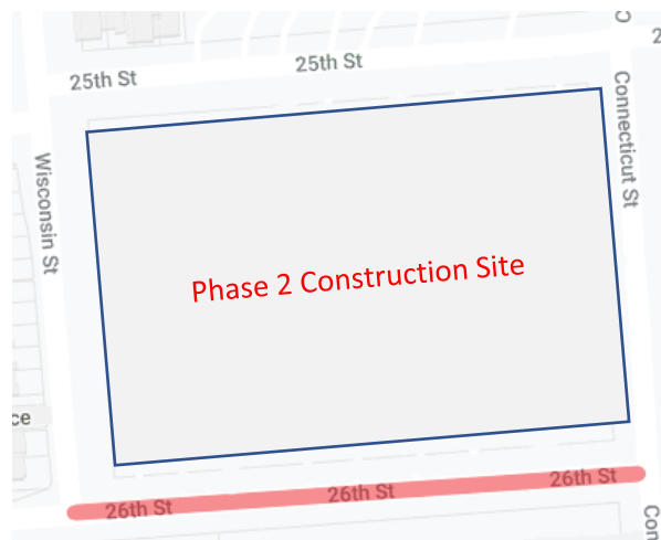
Figure 1: Pinpoint of the two work locations below at A) 26th & Connecticut & B) 26th & Wisconsin