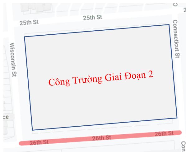
Hình 1: Điểm chính xác của hai vị trí làm việc dưới đây tại A) 26th và Dg. Connecticut và B) 26th và Dg. Wisconsin

Cyrus Hoda, Đồng Quản Lý Dự án BRIDGE Housing 415.321.3585, choda@bridgehousing.com