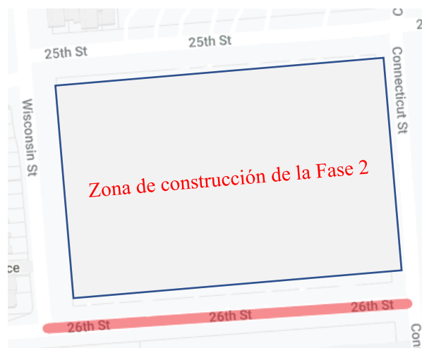
Figura 2: Localización de los dos sitios de trabajo a continuación en A) la calle 26 y Connecticut y B) la calle 26 y Wisconsin.

Cyrus Hoda, Director de Proyecto Asociado BRIDGE Housing 415.321.3585, choda@bridgehousing.com